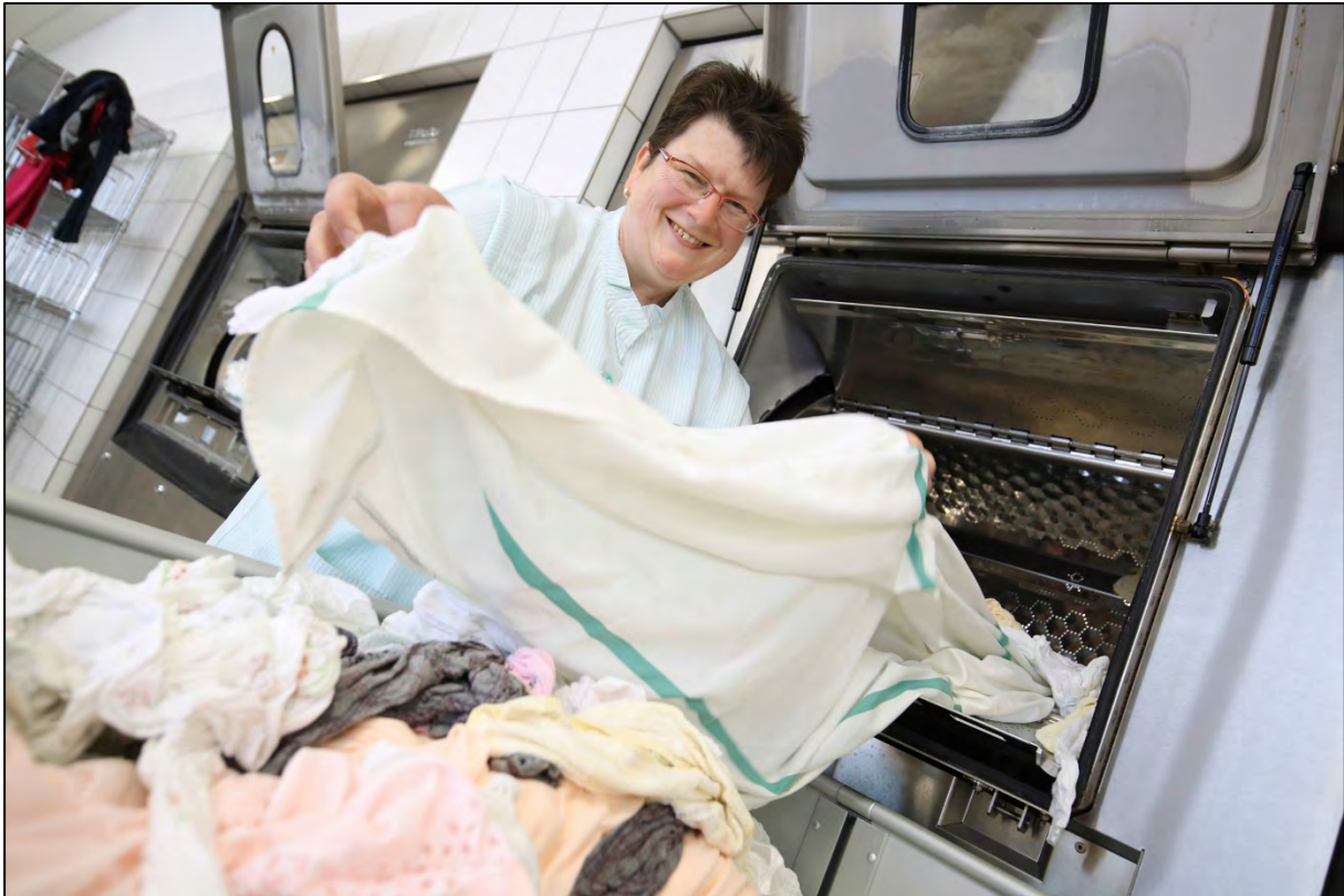
Abb. 3: Trennwandmaschine beim Entladen auf der reinen Seite

Von der reinen Seite aus wird die Wäsche in der Maschine entladen (siehe Abb. 3). Anschließend wird die Wäsche im Wäschetrockner getrocknet und gemangelt. Nach dem Finishen, Falten und Legen sowie Scannen und Sortieren kann die saubere Wäsche auf der reinen Seite bis zur Auslieferung an die entsprechenden Stellen zwischengelagert werden.