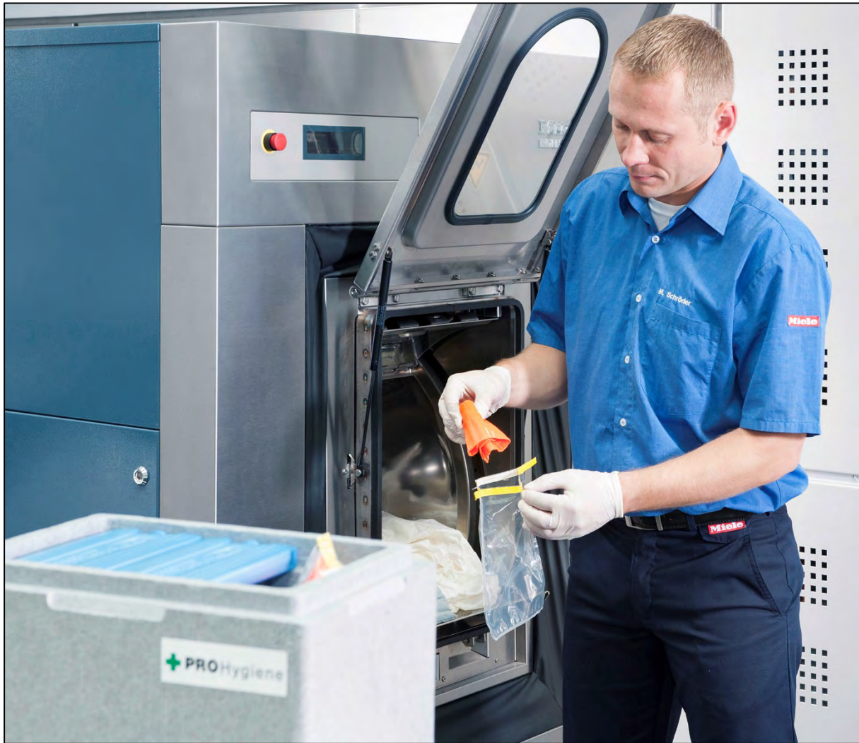
Abb. 4: Entnahme der Stoffstreifen mit Bioindikatoren nach der Wäsche

Im Labor werden die noch vorhandenen Keime und damit das Desinfektionsergebnis ausgewertet. Beide Verfahren erfüllen die Anforderungen an die Krankenhaushygiene des Robert Koch Instituts (RKI 2016). Dabei stellt das Verfahren „ProHygiene Plus“ die höchsten Anforderungen an Waschverfahren und Chemie – auch gemäß der Richtlinien des Verbunds für Angewandte Hygiene e.V. (VAH) –, weil die Stoffstreifen in einem Schutzbeutel aus Baumwolle gewaschen werden, und es sich deshalb um ein so genanntes „Offenes System“ handelt (VAH 2016).