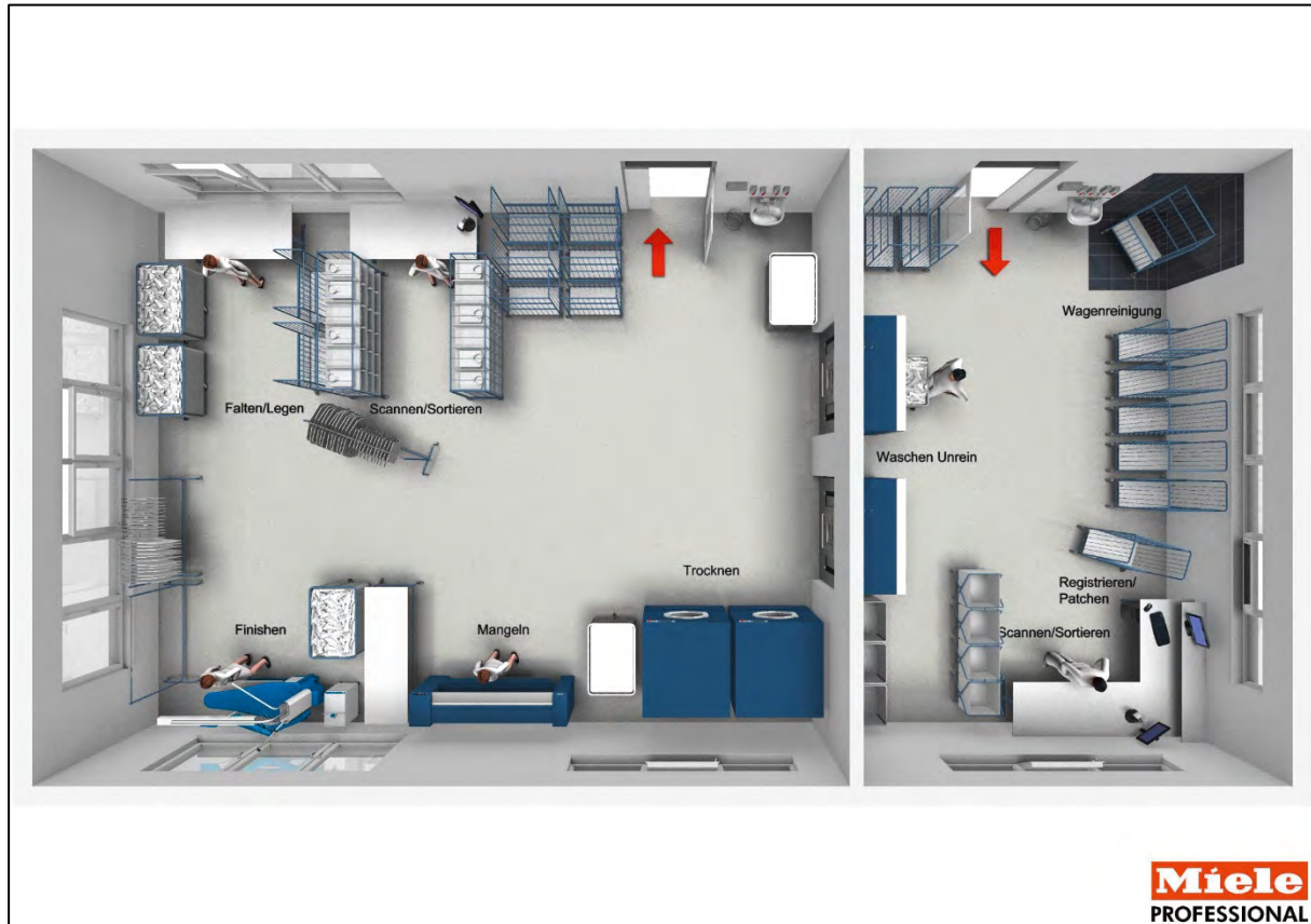
Abb. 2: Bauliche, apparative und personale Trennung von unreiner Seite (rechts) und reiner Seite (links im Bild)